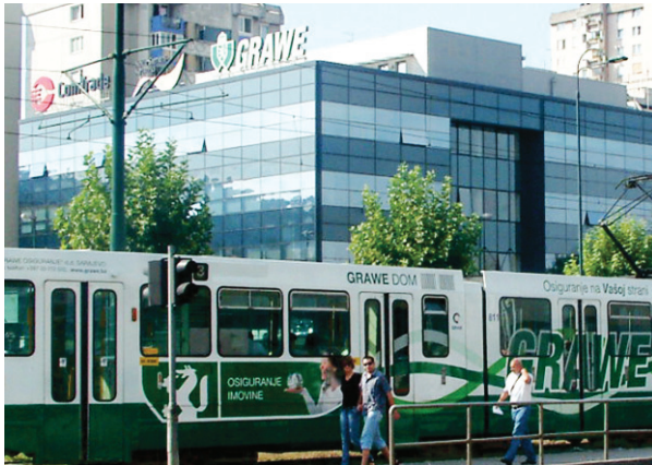
Direkcija GRAWE osiguranja u Sarajevu, BiH